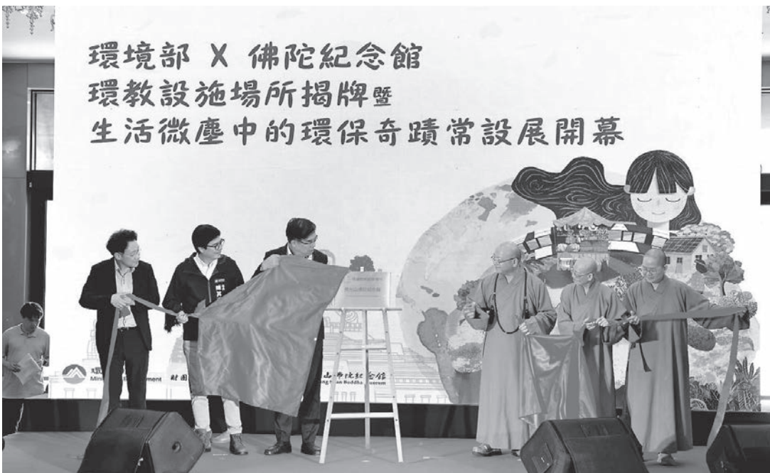
佛光山住持心保和尚(右3)、國際佛光會署理會長慈容法師(右2)、佛館館長如常法師(右1)，與環境部部長彭啓明(左3)、高雄市長陳其邁(左2)、國家環境研究院院長劉宗勇(左1)，一同為佛館成為環教設施場所揭牌。

隨後一行人至禮敬大廳二樓參觀「綠色新世代——生活微塵中的環保奇蹟常設展」，以及佛館環教設施場所等。