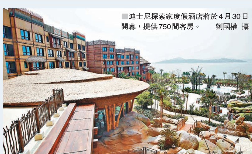
■ 迪士尼探索家度假酒店將於4月30日開幕，提供750間客房。

對於不少訪港旅客均認為香港酒店房價高昂，發言人指出，香港酒店平均房租於去年已按年下跌3.7%至1,287港元，顯示業界正因應市場情況，調整酒店房租的價格，以保持競爭力，相信業界會繼續密切留意市場情況，釐定合適價格，吸引高增值過夜旅客訪港。