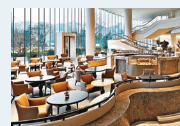
■ 位於紅磡灣的嘉里酒店將於28日開幕，提供546間客房。