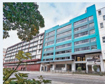
■ 君立酒店是香港市區首間由工廠活化而成的酒店。