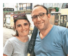
法國旅客： ■ 酒店服務不錯，物有所值。