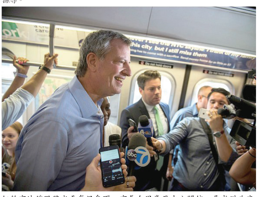
紐約市地鐵服務水平每況愈下，市長白思豪發出公開信，要求州政府解決問題。

(綜合報導)由紐約州政府管理的紐約市百年地鐵系統，近月頻繁出現故障，準時率創出歷史新低的63%。紐約市市長白思豪終於受不了，今日向州政府發出公開信並提出5大要求，包括促請當局立即提升列車服務品質，引入第三方機構評估及訂立營運目標等。白思豪透過市長辦公室發出公開信，向紐約州提出5大要求，包括立即提升列車服務品質及可靠性、訂立營運目標、引入第三方機構評估服務、有效分配財政資源等。 聲明指，有關要求為「所有公營機構的最基本要求」，希望營運紐約市地鐵的大都會運輸署(MTA)，能夠重新建立紐約市居民對交通系統的信心。信中透露過去5年來，紐約市地鐵服務出現延誤的次數大增超過一倍，由2012年每月發生2.8萬次，目前增加至每月高達7萬次。列車服務準時率也較2012年時大跌15%，現僅63%，白思豪坦言「紐約市居民對MTA的服務水準，有數不完感到挫敗的理由」。