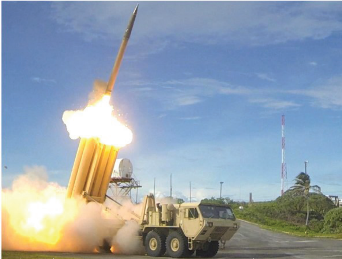
(綜合報導)台灣「中央社」7月25日報導稱，美國國防部星期一(24日)表示，軍方正準備在美國西北部的阿拉斯加再次測試“薩德”系統。美國五角大樓發言人、海軍上校傑夫·戴維斯星期一說，“薩德”系統“即將”進行測試，這些測試屬於“例行性質，以確保此系統備妥”，在實際地緣政治情勢出現前即已排定。美國海岸防衛隊在針對海上活動的通知中說，測試日期可能就在29日。