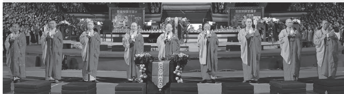
↑禪淨共修法會殊勝之處為萬人獻燈。